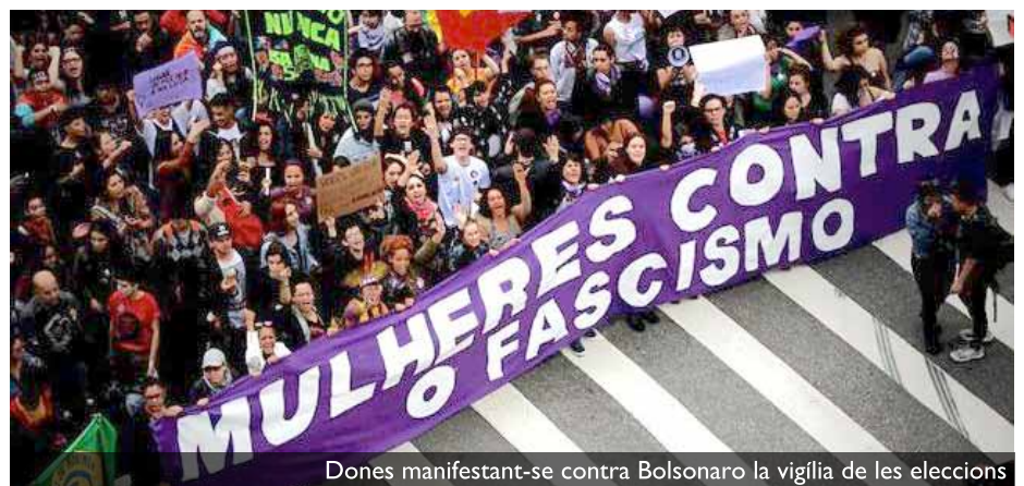
Dones manifestant-se contra Bolsonaro la vigília de les eleccions

El problema més gran de Brasil no és la corrupció, sinó la desigualtat social. Una desigualtat que beu de la història de l'esclavitud i que ha deixat un solatge de racisme en el si de la societat brasilera, que es viu quotidianament quan la policia mata un jove negre de la favela per pensar que el paraigua que du és