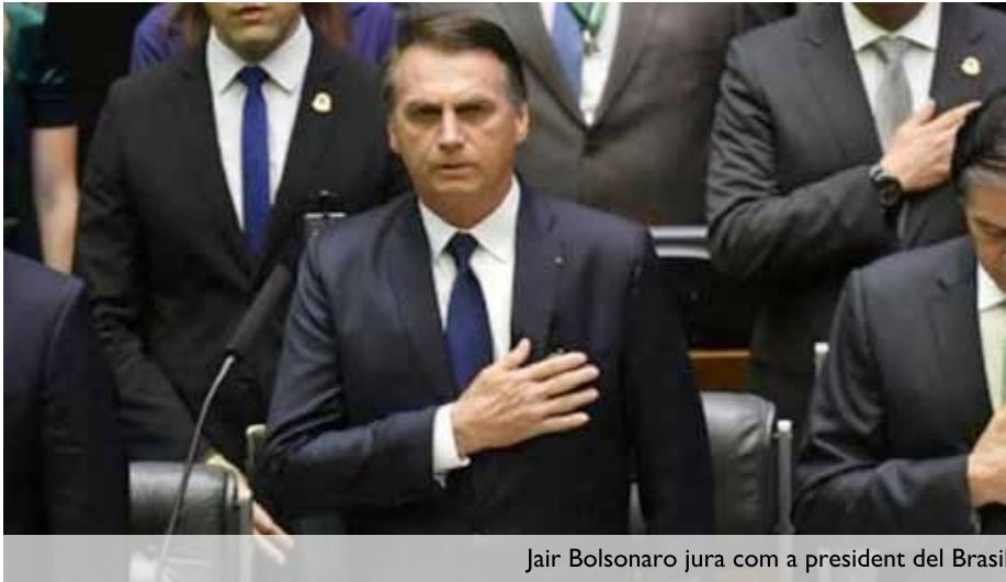
Jair Bolsonaro jura com a president del Brasil