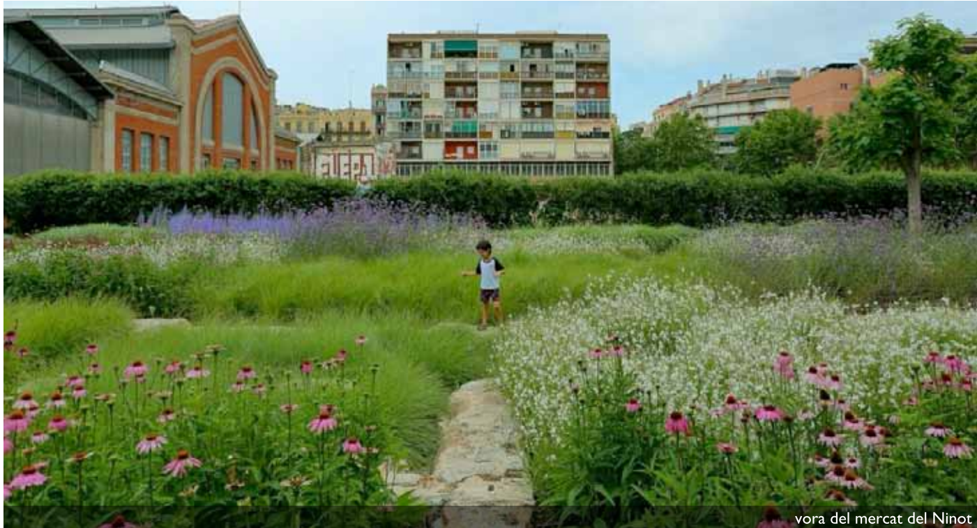
vora del mercat del Ninot