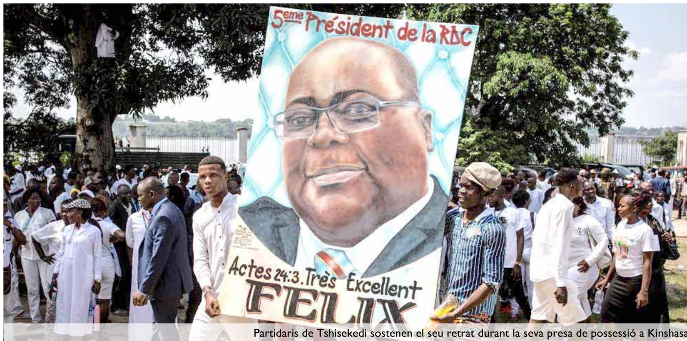
Partidaris de Tshisekedi sostenen el seu retrat durant la seva presa de possessió a Kinshasa

Responsable del projecte de la Lliga a la República Democràtica del Congo