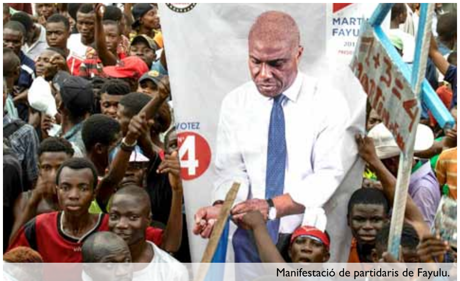
Manifestació de partidaris de Fayulu.

Segons Hans Hobeke, analista de la revista Crisis Grup , el poder ha fet tot el possible per tenir-ho tot controlat. Ha sabotejat l'aplicació de l'acord de Sant Silvestre amb fets com ara el nomenament d'un nou primer ministre sense una consulta àmplia, i la persecució de personalitats de l'oposició per motius polítics. Igualment