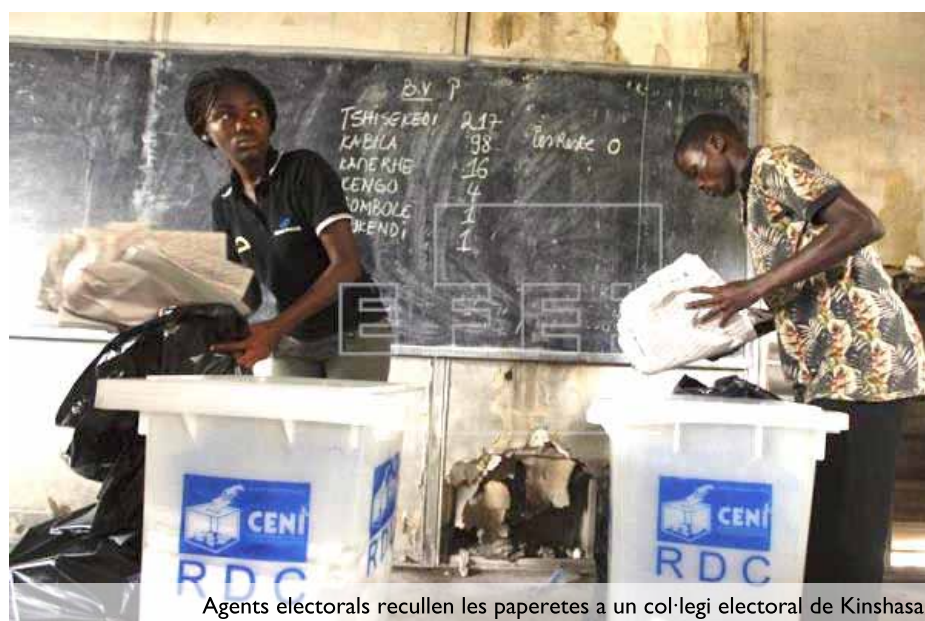
Agents electorals recullen les paperetes a un col·legi electoral de Kinshasa

Un factor important ha caracteritzat aquestes eleccions: la força i el compromís dels moviments socials amb la pau, mobilitzats conjuntament amb la societat congoleesa que ha dit prou. Han pressionat els seus representants per tal d'aconseguir les eleccions, el respecte a la constitució, i han denunciat la vulneració cons-