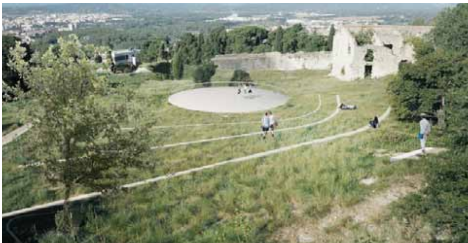
projecte renaturalitzar el castell de Montjuïc de Girona

però, no és el que havíem somiat. Si la inèrcia no s'imposa a la coherència, ens cal replantejar la nostra visió de la història, de l'ésser humà i del món.