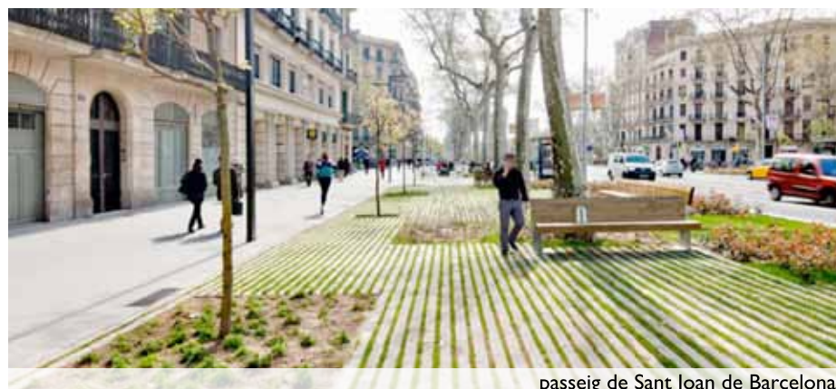
passeig de Sant Joan de Barcelona